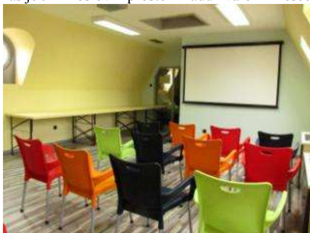
(Trenutni izgled haba Apolo)