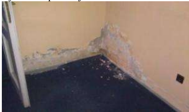
(Izgled prostora pre renoviranja)

Antonić kaže da su odmah po useljenju u januaru prošle godine počeli da stižu ogromni računi, faktura za zajedničke troškove iznosila je 84.000 za prostor koji su iznajmili od 168 kvadratnih metara. Zajednički troškovi obuhvataju grejanje, zajedničku struju, vodu, obezbeđenje celog objekta i održavanje higijene zajedničkih prostorija.