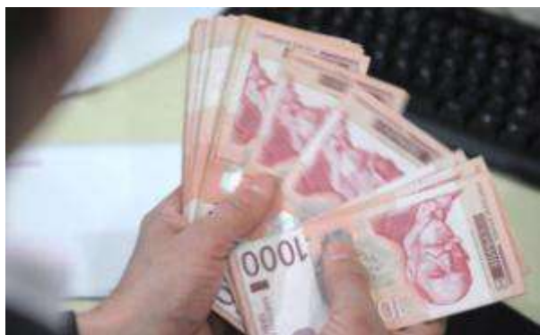
PLATE u ovom delu Evropu godinama unazad ne prate privredni rast. Prošle godine zarade su blago porasle u Makedoniji (2,5 odsto), Crnoj Gori (1,4) i Sloveniji (0,5), dok su u Srbiji pale (2 odsto), baš kao i u Bosni i Hercegovini (1,3) i Hrvatskoj (0,9). U Srbiji su primanja veća, pokazuju podaci Mreže za poslovnu podršku, u malim i srednjim preduzećima, ali su zato velike kompanije i lane štedele na zaposlenima.

Zarade zaposlenih pale za oko dva odsto, najviše zbog najvećih kompanija